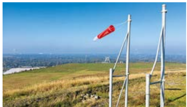
Erste Duftmarke des neuen Fluggebiets: Die Windfahne

köpfige Gruppe den Verein Ruhrpott-Paragliding gegründet und alles bis zur Zulassung durch den DHV als Startplatz für Hängegleiter und Gleitschirme vorangetrieben. Gründungstreffen, Protokolle und Notartermine, Team-Sitzungen, Artenschutz-