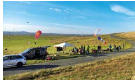
↑ Eröffnungstreffen mit Presse, viel Wind, kleinen Schirmen und „Ruhrpott-Amerikanern“