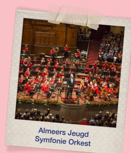
Almeers Jeugd Symfonie Orkest