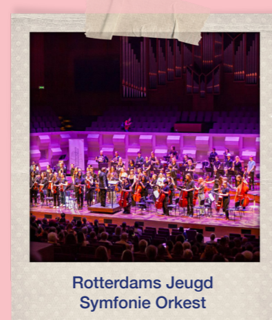
Rotterdams Jeugd Symfonie Orkest