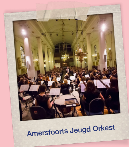
Amersfoorts Jeugd Orkest

Een slotmanifestatie, waarbij de musici van alle orkesten in 45 minuten met het North Sea String Quartet, een improvisatiewerk voorbereiden op het podium in een energieke en bijzondere workshop.