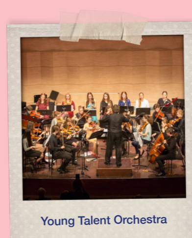
Young Talent Orchestra