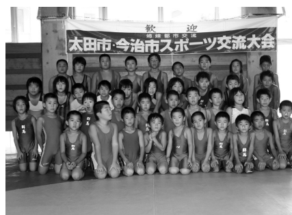
新たに芽生えた交流の輪！