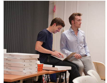
Fast forward: Vooruitblik naar het najaar