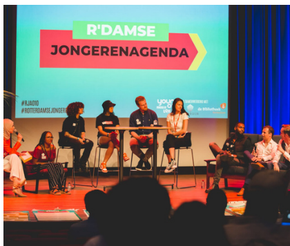
Throwback: hoogtepunten van de afgelopen 4 maanden