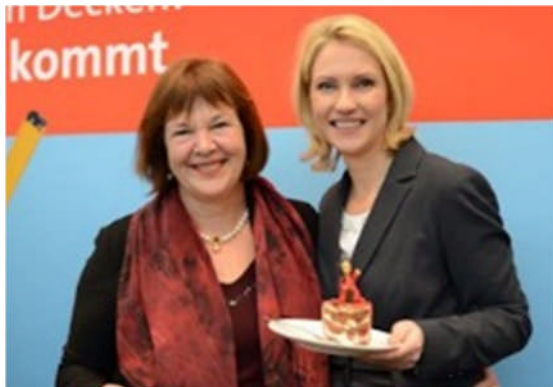
06.03.: Mit Familienministerin Manuela Schwesig feiern wir den Bundestagsbeschluss zum Einstieg in die Frauenquote