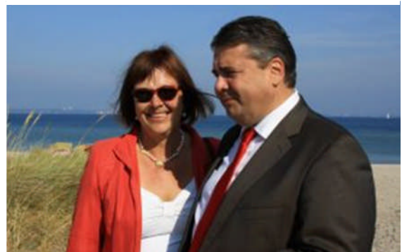
03.12.: Grünes Licht für die Teilerdverkabelung der Ostküstenleitung—nach monatelangem Hin und Her beschließt der Bundestag auf Vorschlag von Wirtschafts- und Energieminister Sigmar Gabriel (Foto September 2013 in Niendorf).