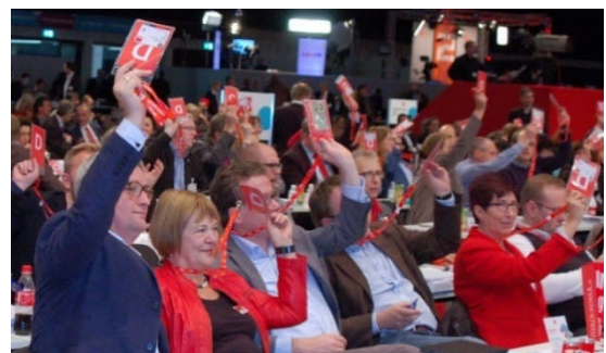
10.12.: breite Zustimmung auf dem SPD-Bundesparteitag von der schleswig-holsteinischen Delegation zu Leitanträgen Friedenspolitik, Integrations- und Flüchtlingspolitik und TTIP