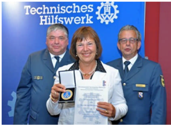
12.11.: Der Haushaltsausschuss beschließt 208 neue Stellen für das THW—und damit ein Plus von 25 Prozent des hauptamtlichen Personals für die 80.000 Ehrenamtler bundesweit. Foto vom August 2014, als ich die Ehrenplakette für meinen langjährigen Einsatz für das THW erhielt.