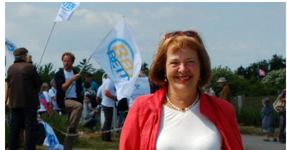
07.06: 300 Aktivisten gegen die Fehmarnbeltquerung auf Einladung der Beltretter in Puttgarden