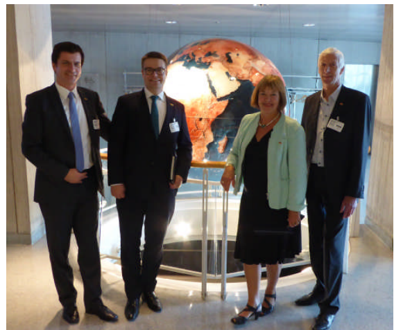
04.-11.10.: Delegationsreise des Rechnungsprüfungsausschusses nach New York und Washington, Besuch von Weltbank, Kongress und Senat, IWF und UNO.