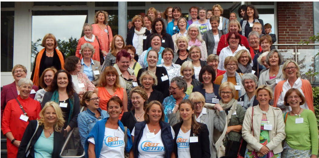
09.07.: Mit den 80 Frauen vom 3. Ostholsteiner Ladies' Day im Bugenhagenwerk Timmendorfer Strand