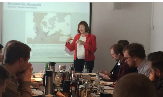
12.03.: Pressekonferenz in Kopenhagen mit dem NABU und Vertretern der 11 wichtigsten dänischen Medien zur Fehmarnbeltquerung