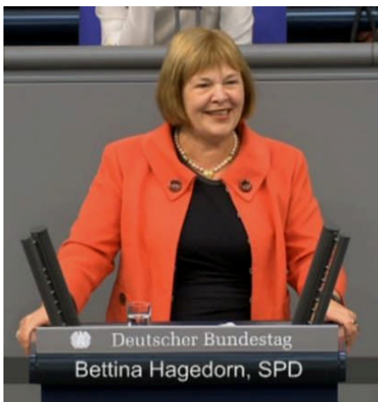
27.11.: ungewöhnliche 22 Minuten Redezeit für mich im Deutschen Bundestag zum Abschluss des Bundeshaushalts 2016 mit dem Verkehrsetat