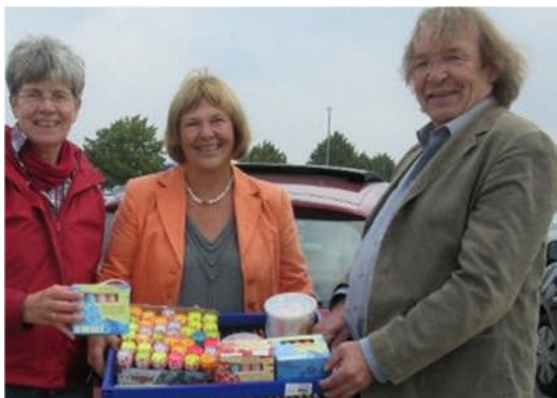
12.09.: Vier Tage, nachdem 800 Flüchtlinge in Putlos als Notunterkunft aufgenommen wurden, bringe ich mit dem SPD-OV Oldenburg Malkreide für die ca. 200 Flüchtlingskinder.