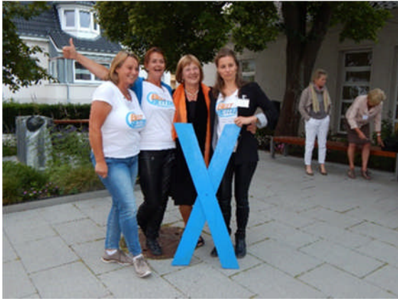
09.07.: Geschenk der BeltretterInnen von Fehrn beim Ladies Day: Seitdem demonstriert das blaue Kreuz Solidarität in meinem Eutiner Wahlkreisbüro.