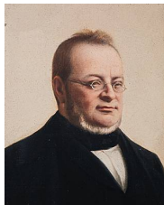
Camillo Cavour (1810-1861)

Issu de la noblesse, il milite pour faire de la Sardaigne une monarchie constitutionnelle. Premier ministre du roi de Sardaigne de 1852 à 1861, il se rallie à l'idée d'une unité italienne autour du Piémont. Il passe un accord secret avec la France permettant à Victor Emmanuel II d'être proclamé roi d'Italie.