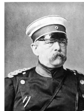
Otto von Bismarck (1815-1898)

Fils du roi Charles-Albert de Sardaigne, il devient roi de Sardaigne à partir de 1849 et fait de Cavour son Premier ministre à partir de 1852. Grâce à un accord secret entre Cavour et Napoléon III, Victor Emmanuel II devient « roi d'Italie » en 1861. Il soutient l'unité italienne et fait de Rome sa capitale.