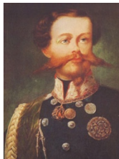
Victor Emmanuel II (1820-1878)

Issu de la noblesse, il milite pour faire de la Sardaigne une monarchie constitutionnelle. Premier ministre du roi de Sardaigne de 1852 à 1861, il se rallie à l'idée d'une unité italienne autour du Piémont. Il passe un accord secret avec la France permettant à Victor Emmanuel II d'être proclamé roi d'Italie.