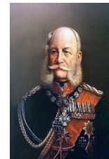
Guillaume I er (1797-1888)

Issu de la noblesse, il est élu député en 1847 et soutient la répression de 1848-1849. Il est nommé chef du gouvernement prussien par Guillaume I er en 1861. Grâce à ses victoires, il est l'artisan de l'unité allemande. Il est chancelier du Reich jusqu'à son renvoi en 1890 par l'Empereur Guillaume II.