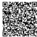
Canadian Food Styleのサイトページ Canadian Food Style website page