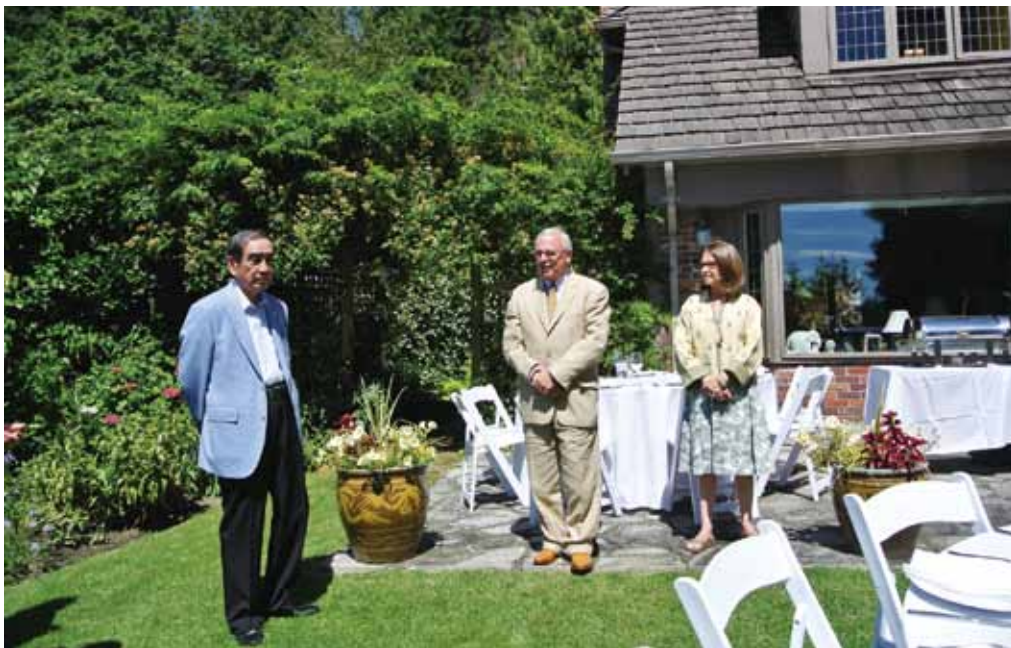
2017年親善訪問での昼食会にて At a luncheon held during the 2017 Goodwill Visit

My biggest hope is that all of the members of the HCA will remain safe and healthy. In the end, this too will pass.