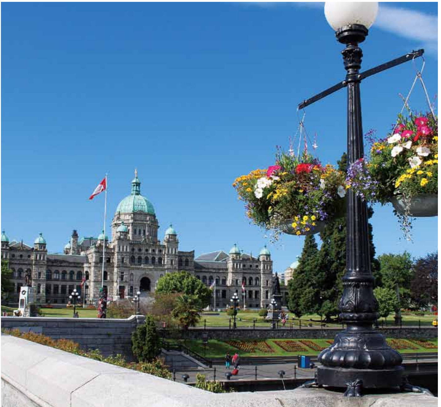
ブリティッシュ・コロンビア州の州都ビクトリアにある州議事堂 Parliament Buildings in Victoria, the capital of British Columbia

ホームページ: https://www.hiroshima-canada.org/