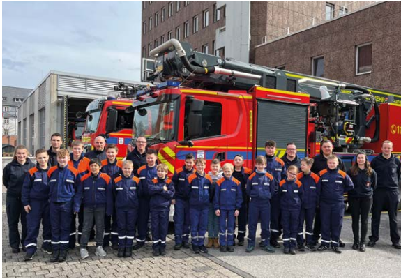
Dieses Jahr Sieger: Die Mädchen und Jungen der Jugendfeuerwehr Linz am Rhein. Sie freuen sich über 3.000 Euro

Schön, wo überall Engagement ist: Für eine lebendige Eisenbahnkultur in Warstein, für neue Bäume in Völlinghausen, für einen neuen Turnraum für die Kita „Kleine Strolche“. 59 Menschen aus den verschiedenen Unternehmungen der Wilhelm Werhahn KG haben sich beworben mit einem Vorschlag für einen gemeinnützigen Verein, den sie persönlich unterstützen. Nestschaukeln, Handball-Trikots und ein Übungs-MRT waren darunter. Gewonnen hat dieses Jahr die Jugendfeuerwehr der Verbandsgemeinde Linz. Sie konnte die meisten Mitarbeiterstimmen auf sich vereinen. Die Truppe der 10- bis 15-Jährigen hat sich im Rahmen ihrer Weihnachtsfeier einen tollen Ausflug zur Stärkung der Gruppengemeinschaft gewünscht. Sie bekommt 3.000 Euro. 2.000 Euro und der zweite Platz sind für den Förderverein der Kita Röcknitz (für ein neues Außengelände), und mit 1.000 Euro kann das Sauerlandlager Straelen unterstützt werden, welches Kindern Sommerferien ermöglicht. Platz 4 – 20 erhalten jeweils 500 Euro. Die übrigen Projekte bekommen einen Zuschuss von 100 Euro. Insgesamt hat die Werhahn Stiftung Preisgelder von 19.200 Euro ausgeschüttet.