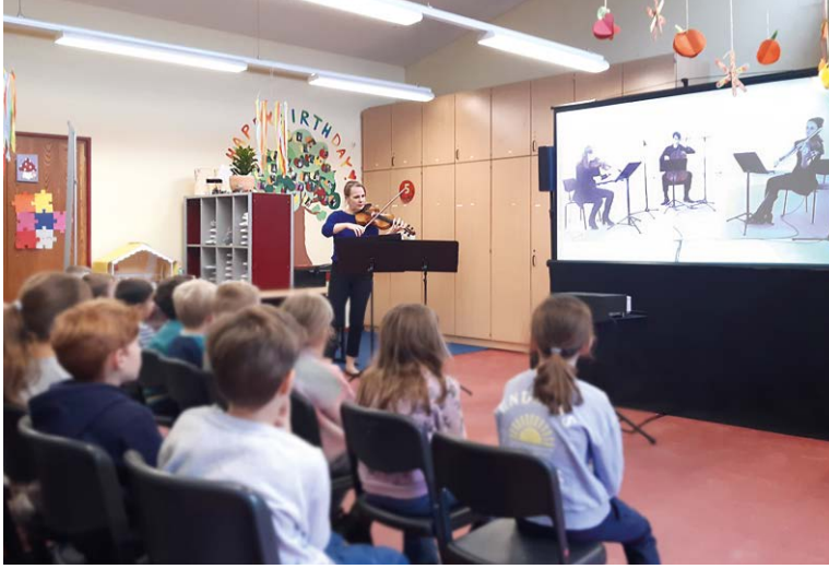
Unglaublich erfolgreich: Das Musiktheater in der Schule