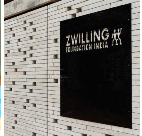
Live-Changing Moments: Spenden mit großer Wirkung