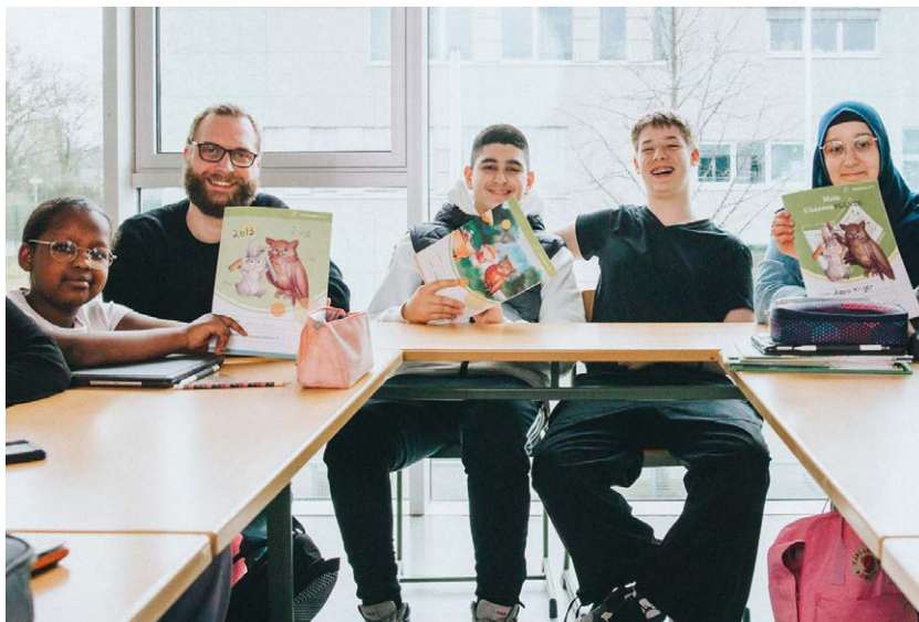
Eigens entwickelt: Fächerübergreifendes Lernmaterial, die Chancen-Hefte

Es sind pro Woche rund 30 Schülerinnen und Schüler, die in der Neusser Janusz-Korczak-Gesamtschule Nachhilfe bekommen. Und zwar von knapp einem Dutzend Älterer aus ihrer Schule: Jungen und Mädchen ab Klasse 9. Mit unserem Zutun als Stiftung reduzieren wir einerseits die Beiträge der Eltern, die sie für die Nachhilfe ihrer 5. bis 8. Klässler aufbringen müssen. Und wir finanzieren die Lernbegleiter mit, die sich um jene nachhilfegebenden Jugendlichen kümmern. Denn auch die brauchen von Fach zu Fach mal selbst Unterstützung.