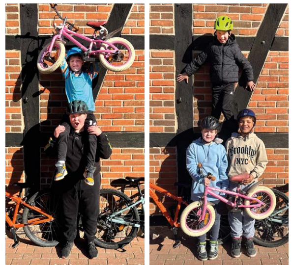
Große Freude: Die Kinder vom Jule Haus, Arendsee