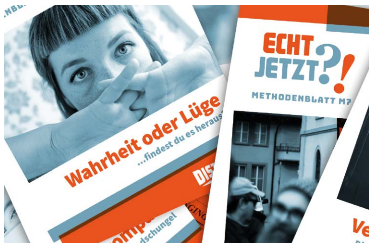
Kostenfrei im Download: Der Methodenkoffer

Die Zielgruppe sind Jugendliche zwischen 15 und 18 Jahren. Aus den Workshops hat sich ein Methodenkoffer entwickelt, der auch pädagogische Fachkräfte zu dem sensiblen Thema schult.