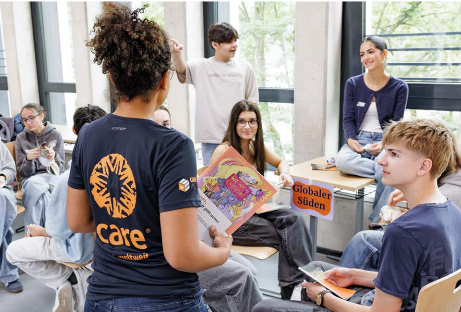
Das Ziel: Spielend Perspektiven wechseln

Themen der Zeit: Klimagerechtigkeit und Migration