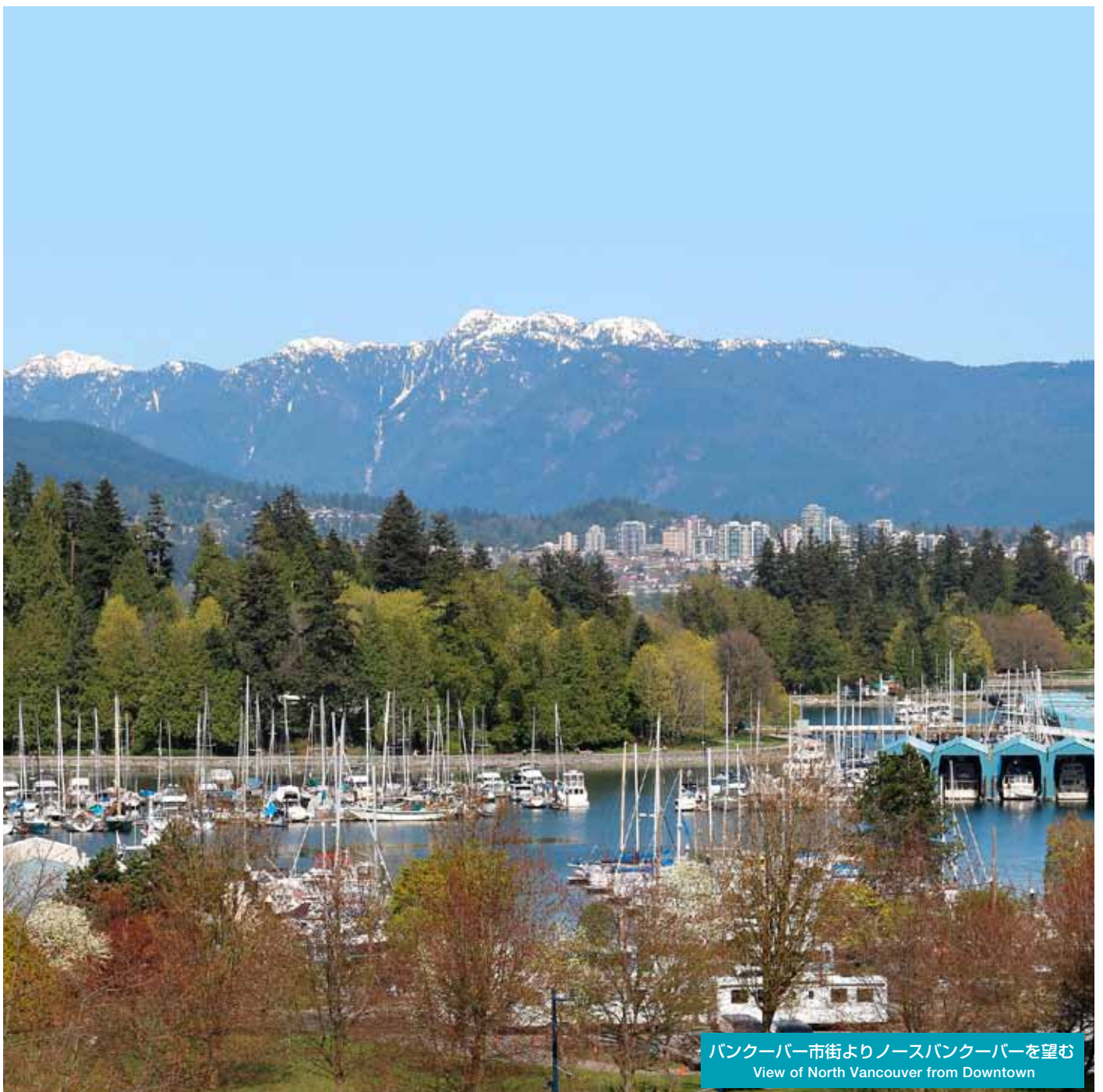
バンクーバー市街よりノースバンクーバーを望む View of North Vancouver from Downtown