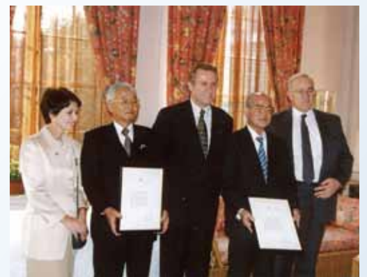
1996年11月 カナダ名誉領事に就任 November, 1996 Appointed as Honorary Consul of Canada