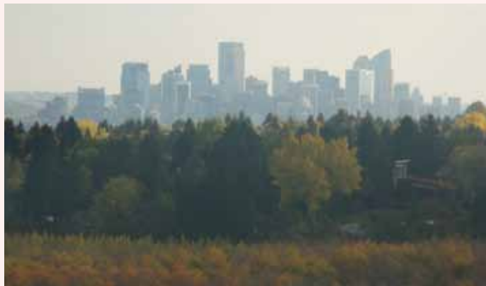
カルガリー中心部 Downtown Calgary skyline

今後、右派の新政権が左派である連邦政府と前向きな関係を構築できるか、カナダの他の州も注目しています。経済の安定、そしてカナダの将来が、新政権の舵取りにかかっているかもしれません。