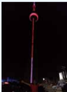
夜のCNタワー (トロント) The CN Tower at night (Toronto)

私は、カナダ第2の都市であるケベック州のモントリオールにも住んだことがあります。モントリオールでは、多くの人は英語も話せますが、日常生活は全てフランス語です。また、トロントと同じく文化のるつぼで、異なる文化の人々が隣り合って暮らしています。モントリオールの方がトロントよりもゆっくり時間が流れていると言われます。それぞれ良さがあり、両都市とも大好きです。まだカナダに行かれたことがない方は、ぜひ、カナダを訪れてみてください。