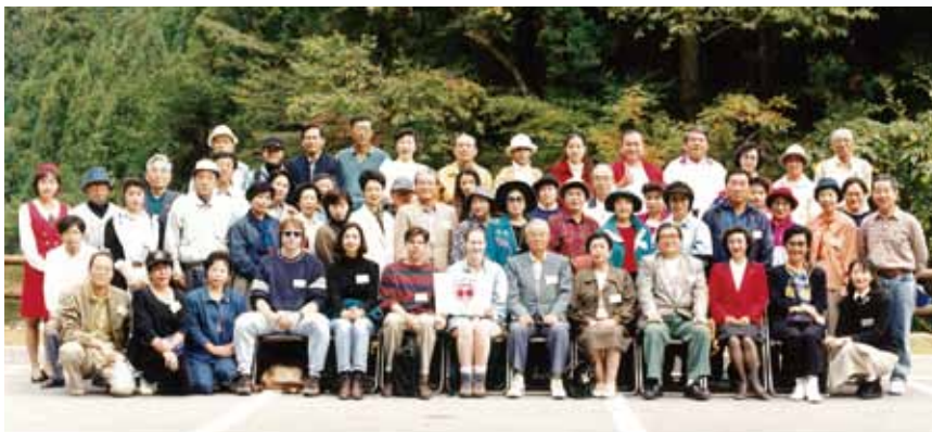
1995年10月 第1回秋のピクニック開催 October, 1995 First HCA Fall Picnic