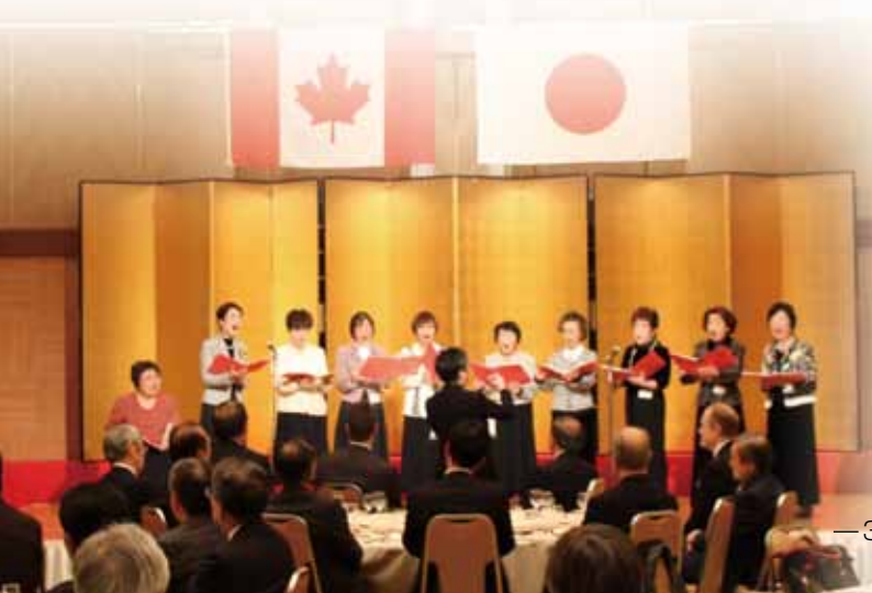
25回目となった合唱団の演奏 The 25th choir performance

後半のビンゴ大会では、会員の皆さまから数多くの景品が寄せられ、参加者も大興奮。その後、会場内の照明が落とされ、バンドの生演奏。会場は一気にクリスマスの雰囲気となり、最後は全員によるキャンドルサービスとクリスマスソングの合唱で来る年の幸せを祈りました。