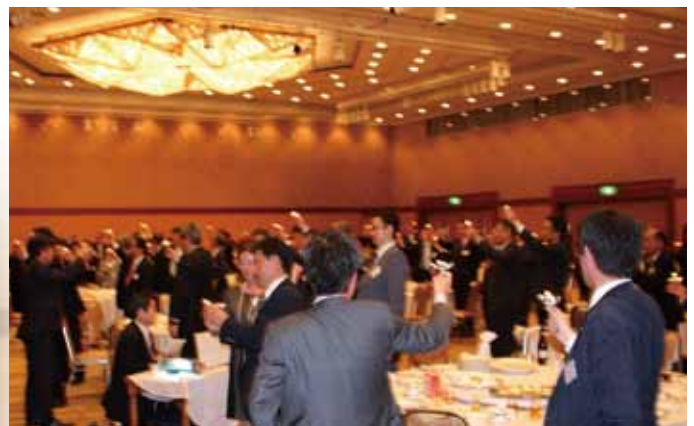
キャンドルサービス Candle Service