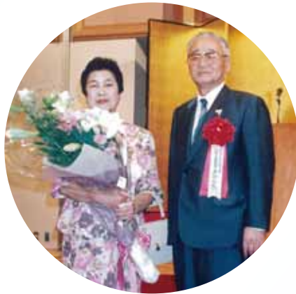
1991年7月 カナダ名誉通商代表 就任祝賀・激励会 July, 1991 Reception on the occasion of being named Honorary Trade Representative of Canada