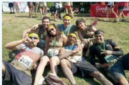
タフ・マダー障害物レース (トロント) Tough Mudder Competition (Toronto)

I have also lived in Montreal, Quebec, the second largest city in Canada where the mainly spoken language is French. Although a vast amount of people also speak English, the day-to-day life is all in French. However, like Toronto, Montreal is a cultural melting pot where people of other cultures live alongside one another. It is said that it has more of a relaxed environment compared to Toronto. I can agree with that statement, but nevertheless love both cities. I can honestly strongly recommend visiting Canada if you have not been there yet.