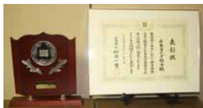
表彰状と楯 Certificate and plaque

協会設立以来、多大なご支援、ご協力をいただいている皆さまに感謝申し上げますとともに、広島とカナダの絆がより強いものとなるよう、心持ち新たに活動を続けてまいりたいと存じます。