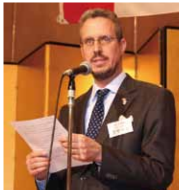
ラサール領事 Consul La Salle