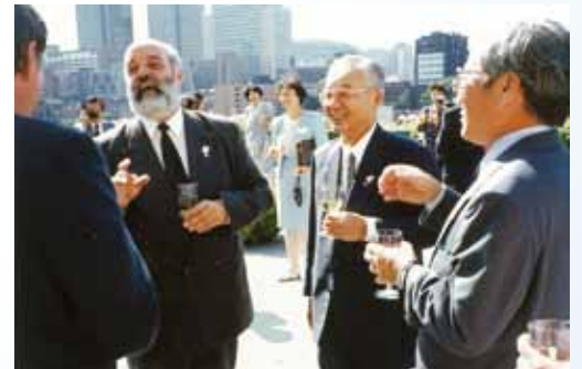
1992年8月 第1回カナダ親善訪問 August, 1992 First Goodwill Mission to Canada