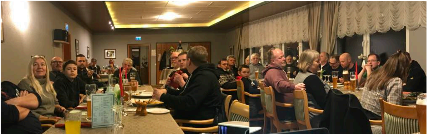
Wieder einmal volles Haus bei der JHV am 03.03. in der Pizzeria Milano