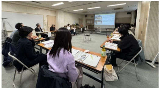
総合避難訓練・防災フェアの結果報告