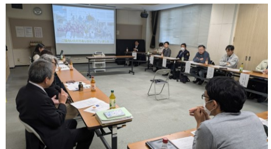
参加者から感想・意見（早稲田公民館）