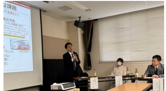
松井 一洋 名誉教授による講演