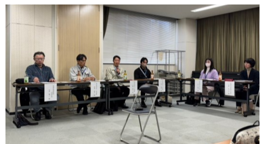
参加者から感想・意見（地域起こし推進課）