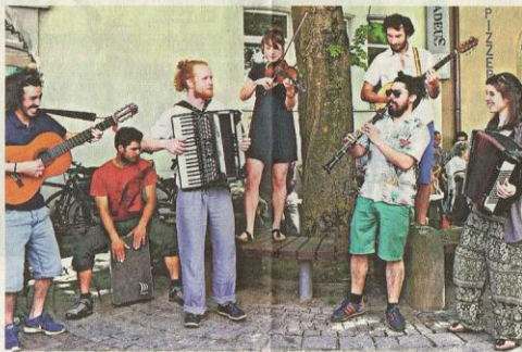
Musiker aus unterschiedlichsten Kulturen spielen in der Band DieVagari aus Tübingen