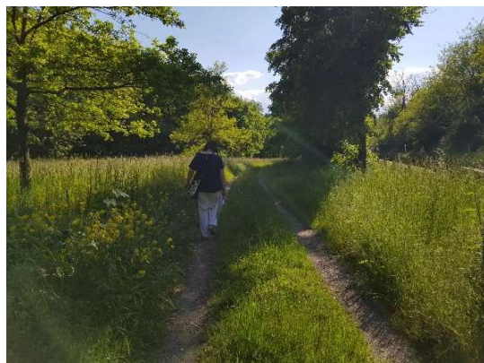
Foto: L 520 mit erster Abbiegemöglichkeit links

Empfehlenswerter ist allerdings, rund 100 Meter später links auf den spitzwinklig zunächst fast parallel zu Straße verlaufenden hübschen Wiesenweg abzubiegen.