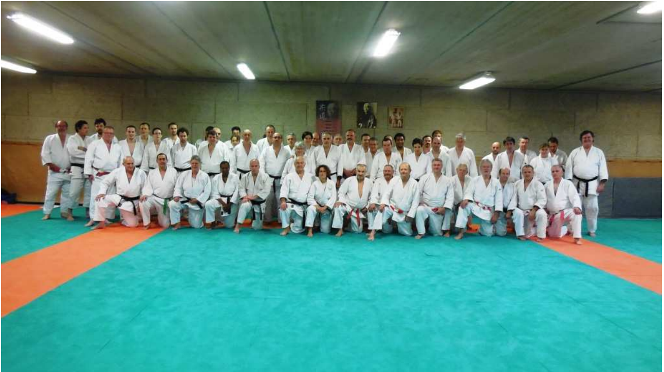
Cérémonie des vœux à Andresy