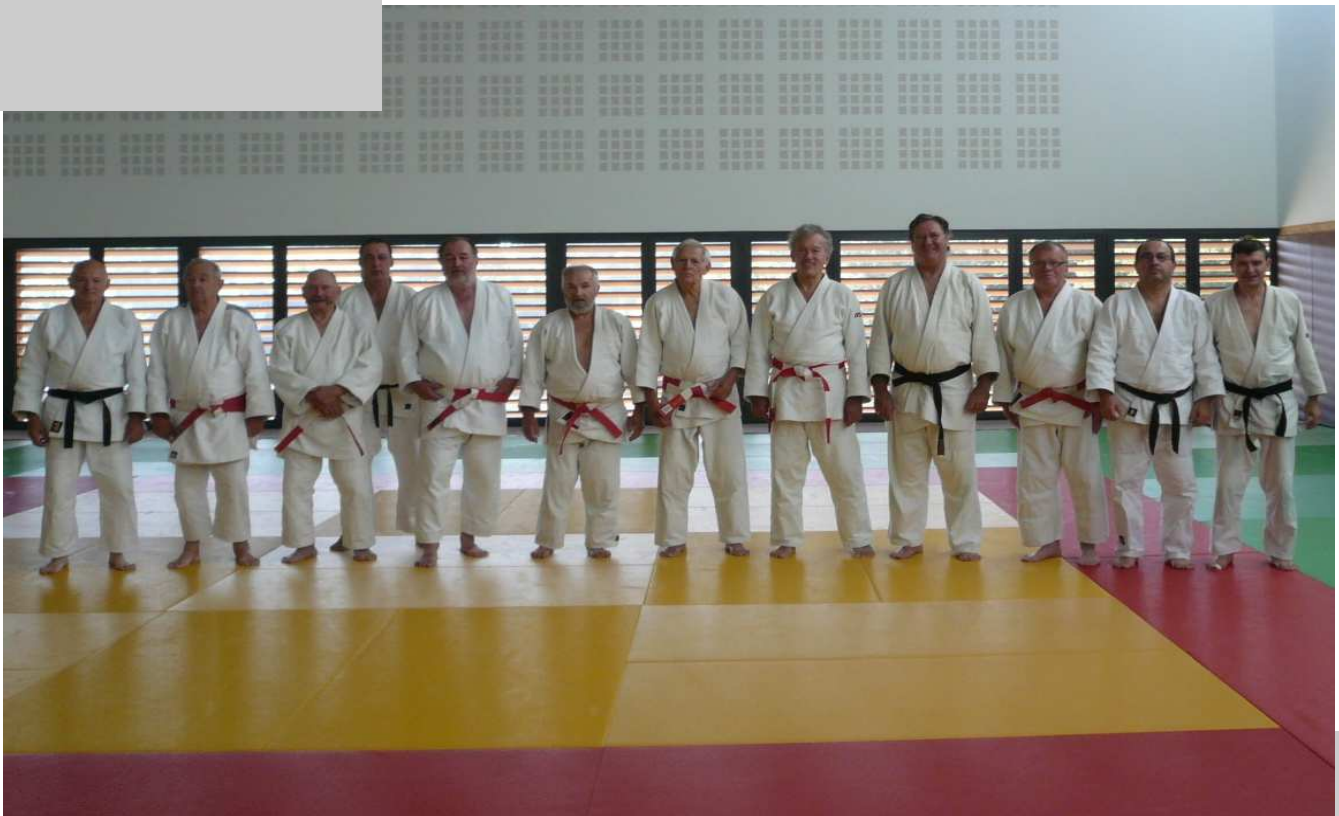
Rencontre du CIJAM à Mûr de Bretagne octobre