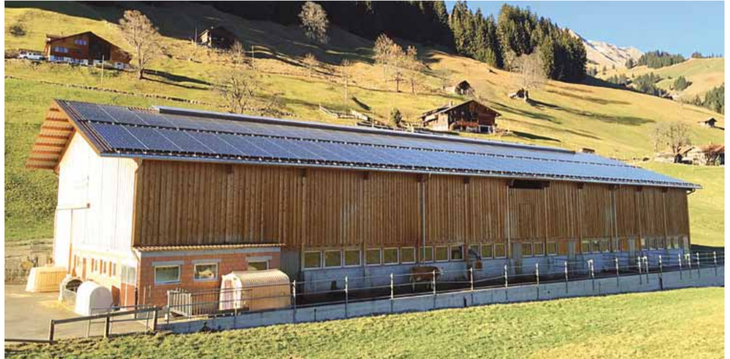
Wenn der Betreiber dieser Solaranlage zu jedem Nachbarn eine eigene Stromleitung bauen muss, kosten die Leitungen mehr als die Solaranlage Ried bei Frutigen | Foto + Solaranlage: Peter Stutz