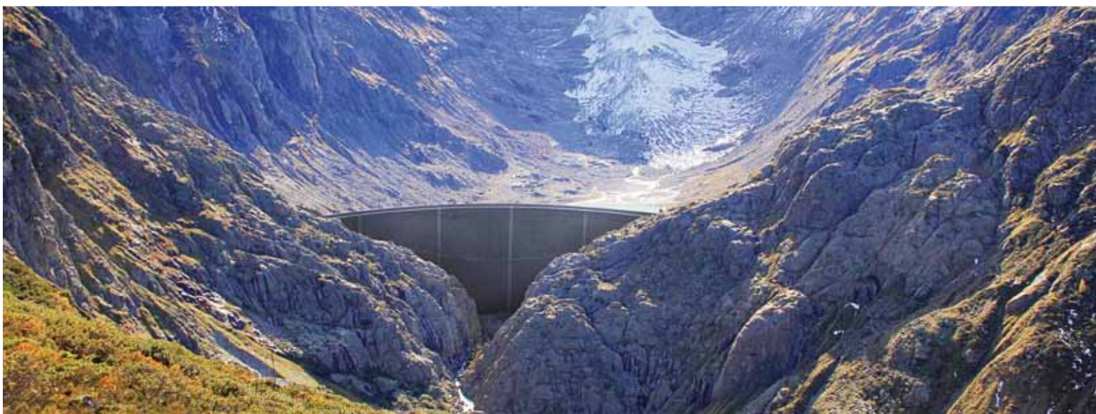
Fotomontage der Staumauer des Triftsees. Der Gletscher im Hintergrund ist bereits heute weggeschmolzen.