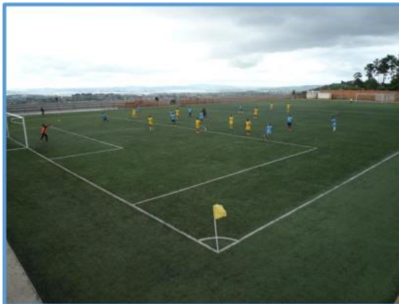
Kunstrasenfußballplatzplatz – Bemasoandro