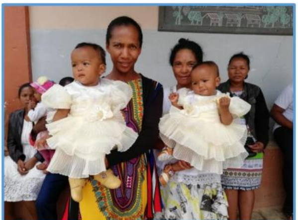
Zwilling geboren in Manantenasoa