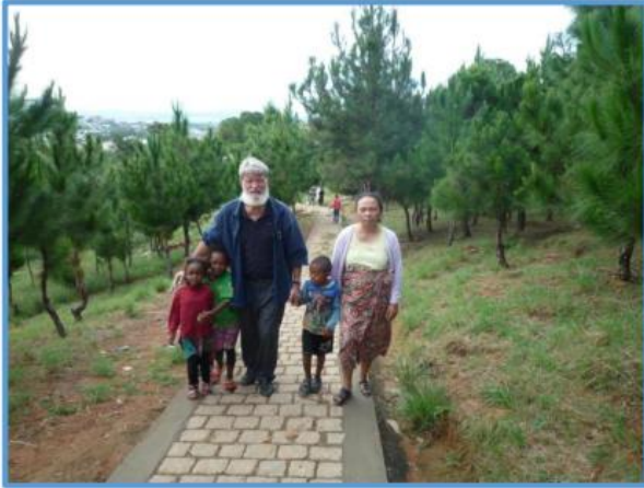
Weg im wiederaufgeforsteten Wald