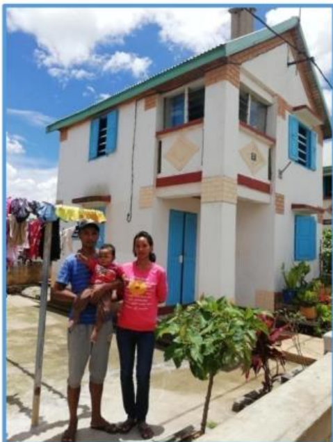
Eine Familie und ihr Haus