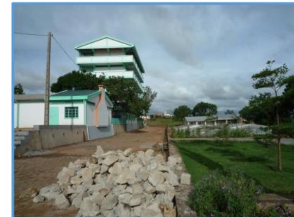
Grundschule - Mahatsara