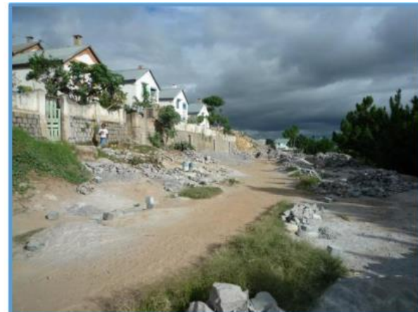
Steinbruch und Häuser -Bemasoandro