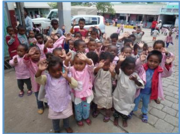
Kinder des Kindergartens -Andalanitra