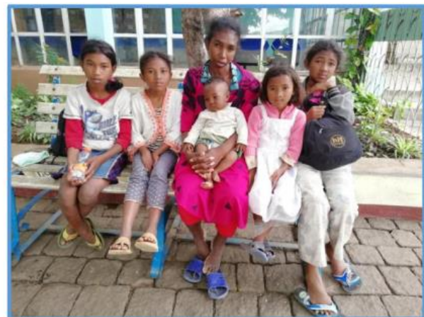
Frau allein mit 5 Kindern