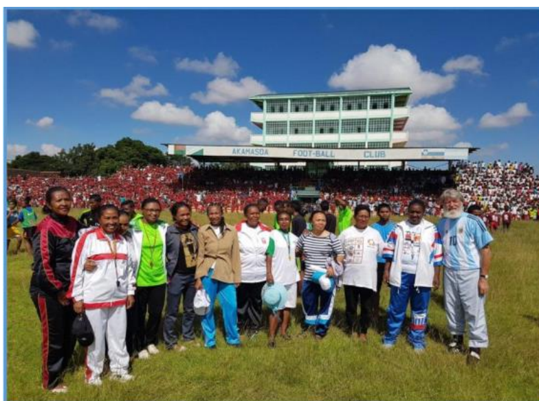
Fête de l'école à Andralanitra