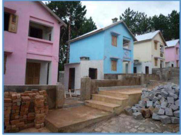
neue Häuser in Mahatsara