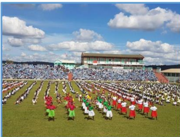
Fest im Stadion von Andralanitra