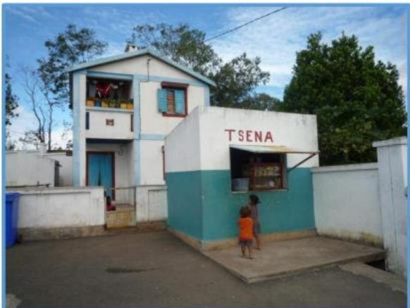
Haus und Bäckerei - Bemasoandro