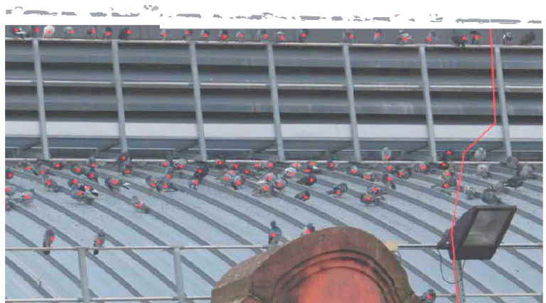
Beispiel einer Fotoauswertung (Ausschnitt)

Bei einer größeren Anzahl der zu erfassenden Tiere oder bei zu großer räumlicher Distanz zum Zähler (z. B. auf Dächern) werden Fotos gemacht. Die Fotos können am Computer in einem Bildbearbeitungsprogramm vergrößert und mit Hilfslinien oder Punkten versehen werden, um die Zählung zu erleichtern.