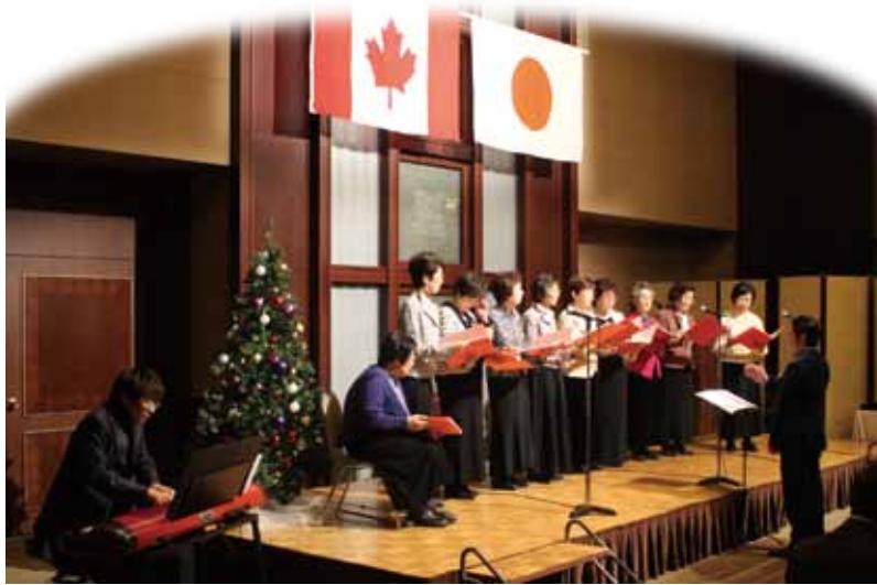
合唱団による演奏 Performance by the choir