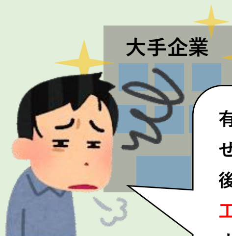
E様/共同住宅オーナー

大手=安心とは限りません！ 会社の規模にかかわらず、管理システムが確立 されているかが重要です!!