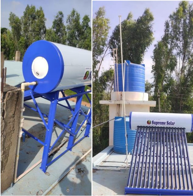
Nowa instalacja solarna