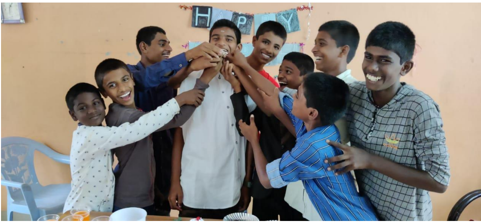
... Urodziny ... Urodziny