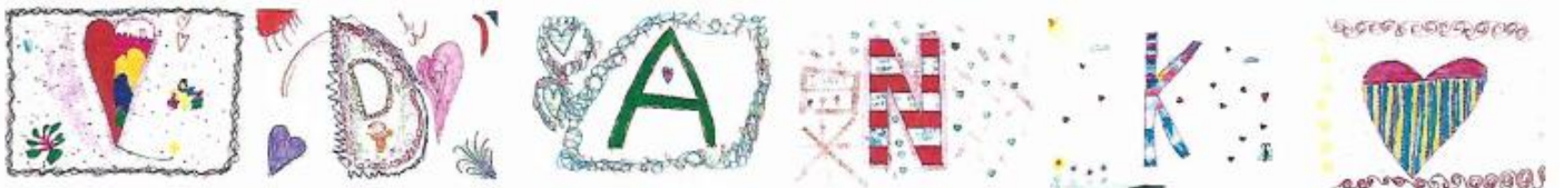
Bilder: 2. Klasse

die Kinder und die Lehrerschaft der Primarschule March